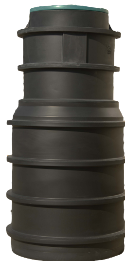
DELFIN SP 1000/800