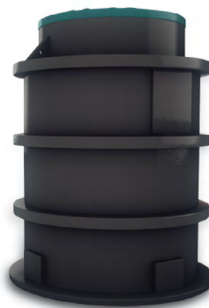
DELFIN SP 800

Pompowanie (podnoszenie) ścieków surowych bezpośrednio z kanalizacji.